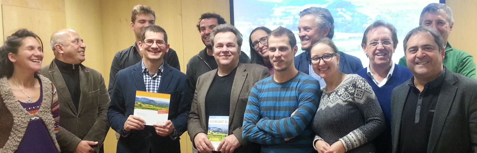
Presentación en el Palau Macaya de Barcelona